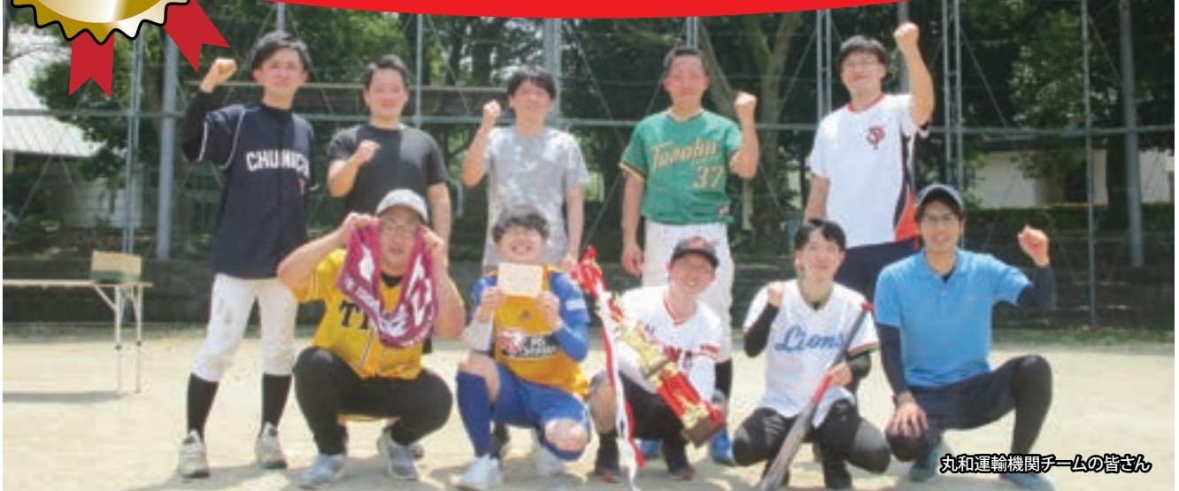
丸和運輸機関チームの皆さん